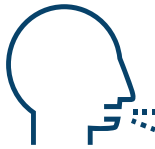
Toux (ou toux qui s'aggrave)