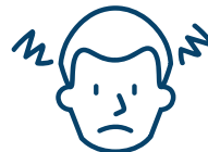
Mal de tête