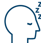
Fatigue / épuisement