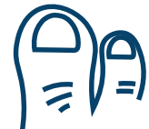
Taches mauves sur les doigts ou les orteils (chez les enfants)