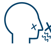
Perte de l'odorat et du goût